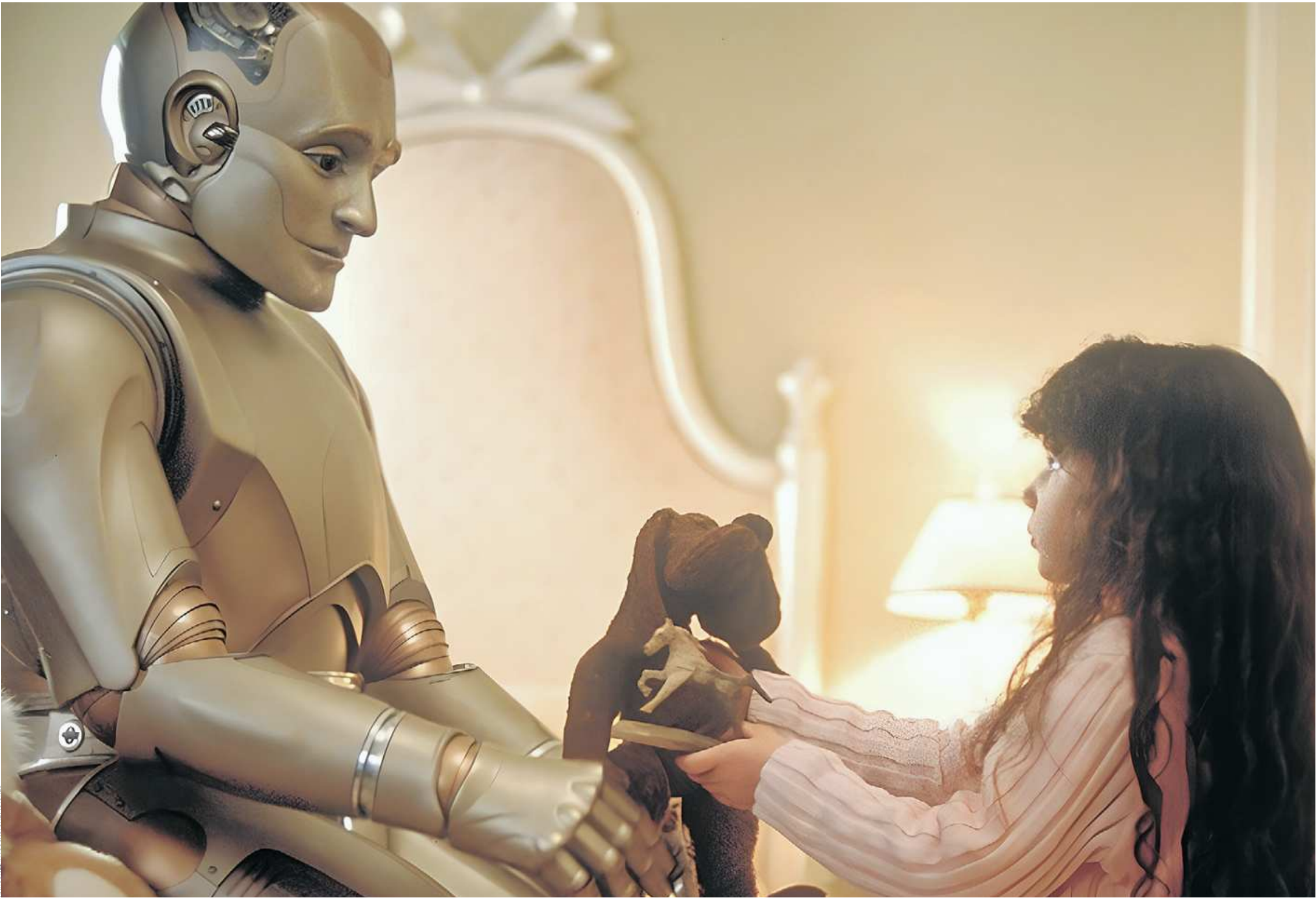
Кадр из фильма «Двухсотлетний человек» 1999 года. В ролях: Робин Уильямс и Халли Кейт Айзенберг

— Разумеется, я имею в виду не сходство нейросетей с его эстетикой, а сам принцип сдвига. Революции бывают громкими, а бывают едва слышными — они меняют устройство мира так незаметно, что современники обнаруживают последствия лишь постфактум. Появление генеративных моделей — из этой же серии. Кафка хотел, чтобы никто и никогда не прочитал его тексты. Он оставил завещание, предписывавшее их уничтожить. Завещание было «предано» его другом, и Кафка оказался одним из самых бесспорных и радикальных новаторов словесности. Его революция произошла тихо и изменила все задолго до того, как это стало очевидно всем. Сегодняшняя ситуация во многом повторяет ту же динамику: перемены уже произошли, они позади, но не все готовы их за-