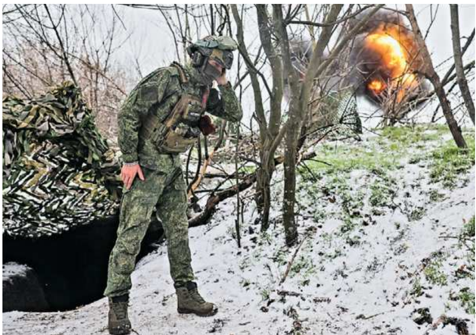
30 декабря 2025 года. Военнослужащий артиллерийского подразделения 49-й общевойсковой армии в составе группировки войск «Днепр» во время боевой работы расчета 152-мм гаубицы 2А36 «Гиацинт-Б» в зоне проведения спецоперации. Такая крупнокалиберная артиллерия предназначена для подавления и уничтожения живой силы, огневых средств, вооружения и военной техники противника в местах сосредоточения и опорных пунктах.