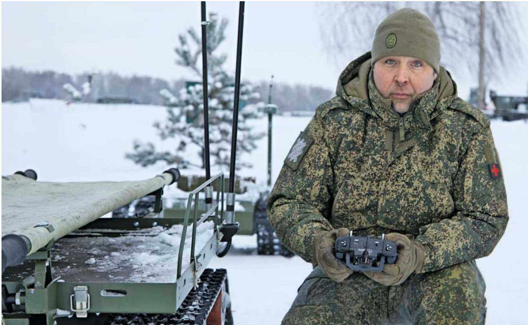
8 января. Командир медицинского взвода 22-го мотострелкового полка группировки «Север» с позывным «Цыган» показывает наземный роботизированный комплекс, который помогает эвакуировать раненых.