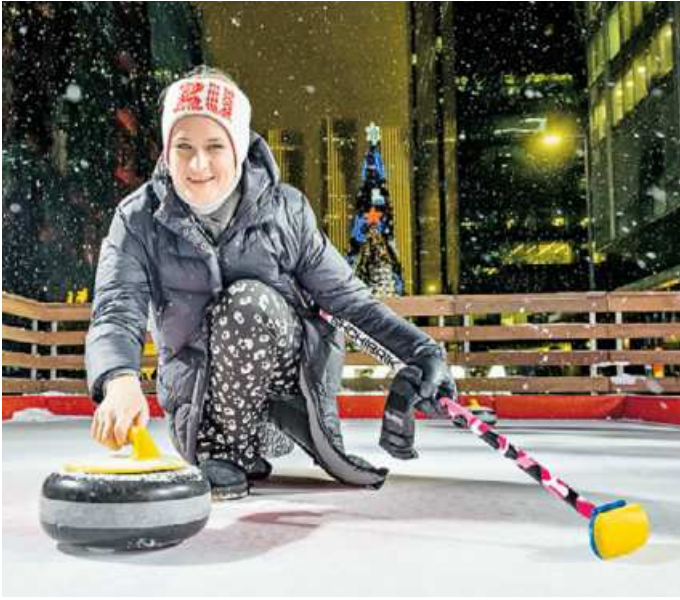
30 декабря 2025 года. Трехкратная чемпионка Европы Маргарита Фомина проводит мастер-класс в пешеходной зоне «Москвы-Сити».

Последние годы керлинг набирает все большую популярность среди москвичей. — Мы поддерживаем развитие городских пространств для активного отдыха. Поэтому в новом керлинг-центре в «Москве-Сити», который мы открыли в рамках проекта «Зима в Москве», мы запускаем серию мастер-классов для всех желающих с профессиональным тренером по керлингу. Это отличная возможность для москвичей и гостей столицы бесплатно попробовать необычный зимний спорт и разнообразить свой досуг, — отметил заместитель мэра Москвы по вопросам транспорта и промышленности Максим Ликсутов. Площадка работает каждый день с 10:00 до 21:30. Продолжительность сеанса — полчаса, после каждого из них — 30-минутный технический перерыв. По правилам керлинга, на площадке играют две команды по 4–5 человек. Это значит, что на одном сеансе может быть не более 10 участников. Один из первых мастер-классов для горожан провела трехкратная чемпионка Европы, серебряный призер чемпионаты мира 2017 года, заслуженный мастер спорта России Маргарита Фомина. — Керлинг — это сложный, но интересный и азартный вид спорта. Я постаралась показать москвичам основы игры,